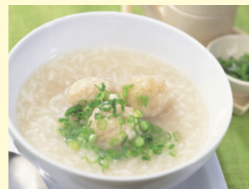
病気の際は病人食も対応