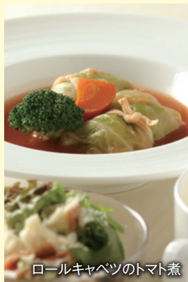
ロールキャベツのトマト煮