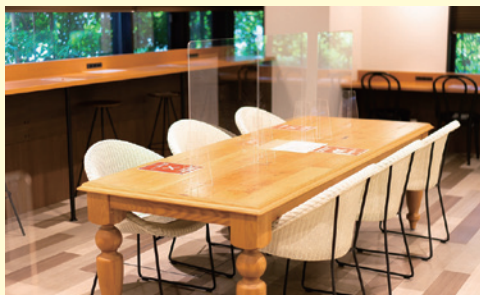
徹底した 衛生管理