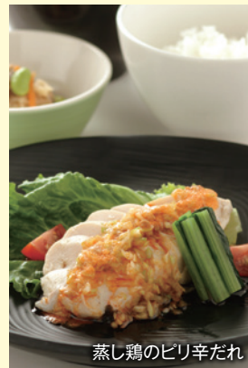
蒸し鶏のピリ辛だれ