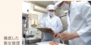
徹底した 衛生管理