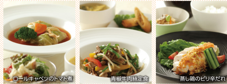
ロールキャベツのトマト煮 青椒牛肉糸足食 蒸し鶏のピリ辛だれ