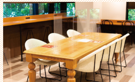
テーブルの上にアクリル板を設置