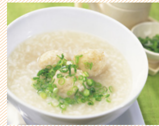
病気の際は病人食も対応