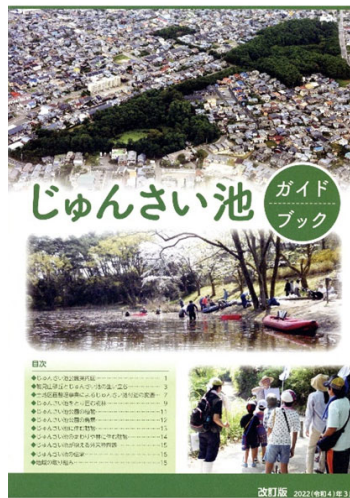
じゅんさい池ガイドブック 2021年発行