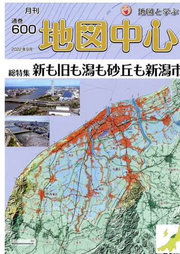
月間地図中心 2022年9月発行