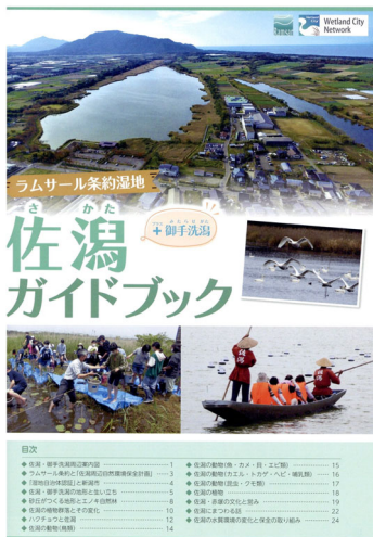
佐潟ガイドブック 2023年発行