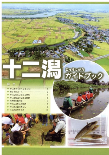
十二潟ガイドブック 2020年発行

これらのほかに、一般愛好者向けの雑誌にも研究成果を発表しています。2023年2月5日は新潟市が「ラムサール条約湿地自治体認証」を国内最初で受けたことを記念するシンポジウムにも出演しました。