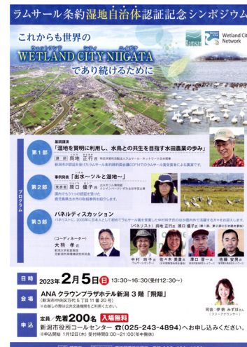
ラムサール条約湿地自治体認証記念 シンポジウム 2023年2月開催