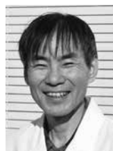
しげまつ とおる 重松 亨

1959年生まれ。博士(心理学)。専門は社会心理学。著書:「よくわかる人間関係の心理学」「誰でもいいから殺したかった:追いつめられた青少年の心理」など。出演歴: NHK「あざイチ」、フジテレビ「とくダネ!」、TBS「サンデーモーニング」など。