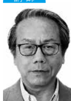
そう しさい 曾 士才