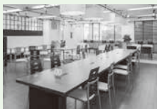
オープンラウンジ

個人またはグループで、さまざまな人との交流の場を提供します。イベント時は客席として、電源、WiFi完備。