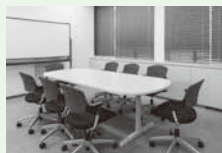
ミーティングルーム

個人またはグループで、さまざまな人との交流の場を提供します。イベント時は客席として、電源、WiFi完備。