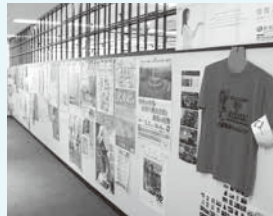
2階掲示用ボードコーナー