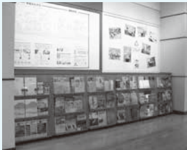
1階ラックコーナー