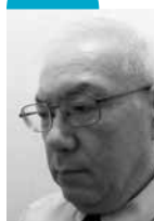
はせがわ きよし 長谷川 潔